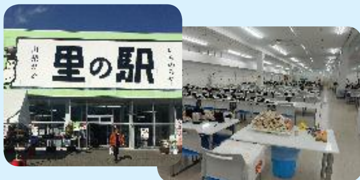
里の駅 & 大食堂 (和食レストラン) お買い物もお食事もここで安心♪

以上のことから一泊交流会での訪問先絞り込みに悩むところですが、あんまり何度も乗り降りするのも考えもの。2日間の昼食、ワインの試飲、お土産購入、写真撮影場所、また悪天候の場合も加味して最終的にスケジュールを決定しました。素敵な旅行が楽しめそうです。ぜひとも多くの方の参加をお待ちしています。