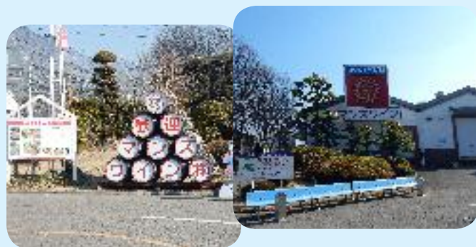
マンズワイン & 万寿園 (昼食 BBQ) 工場見学のあとはお楽しみ…?