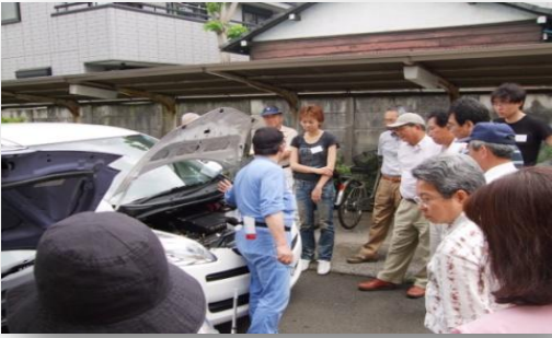
福祉有償運送運転者講習会風景 7/3